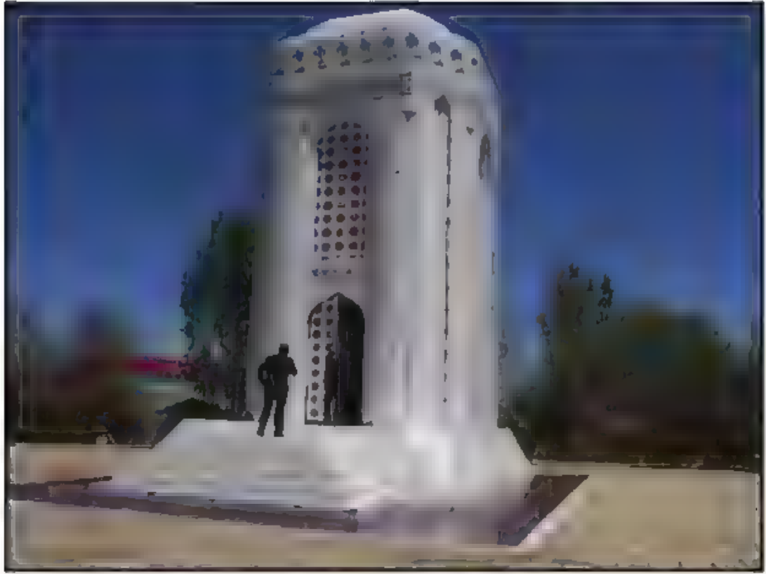
Azeri Şair Hüseyin Cavid'in Kabri